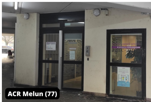
ACR Melun (77)

En mars 2020, la crise sanitaire avait entraîné l'arrêt de ces permanences. A la suite de la levée des restrictions relatives à l'accueil du public, les conseiller(ère)s ont repris le chemin des permanences en dehors de leur site d'affectation et, en même temps, ont dû s'adapter à du nouveau matériel et une nouvelle méthode de travail avec le déploiement de l'écosystème ALICE (Application de liquidation Centralisée). Avant ce déploiement, il(elle)s se rendaient à ces permanences uniquement avec une tablette qui leur permettait de photographier les documents apportés par les clients lors des rendez-vous pour les intégrer ensuite dans les dossiers de retraite complémentaire (Agirc-Arrco et Ircantec) auparavant ouverts en PRC.